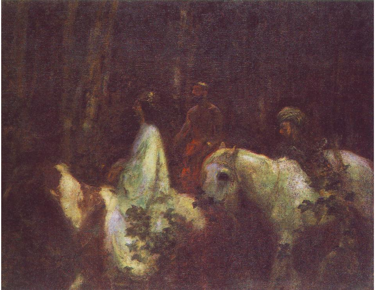
Háromkirályok , 1898, olaj, vászon, 155,5 x 192 cm, Magyar Nemzeti Galéria

érezik, mert vezeti őket valami nagyon határozottan érzett bizonyosság. E sötétségben már a világosság ígérete sóhajt, moccan – mint az anyaméh homályában a születésre készülődő magzat. A lombok között lágyan átszűrődő fény végigsimít rajtuk és átszínezi, magába olvasztja őket, mintha teremtő kedvében vissza akarná olvasztani alakjukat az ősi egységbe, hogy a fizikai és a szellemi létezés határán lebegtesse festői lényeggé fogalmazott valóságukat.